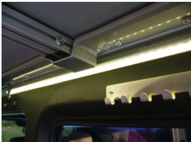
LED – Innenleuchte