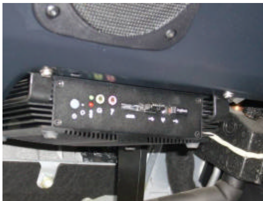
CAR - PC